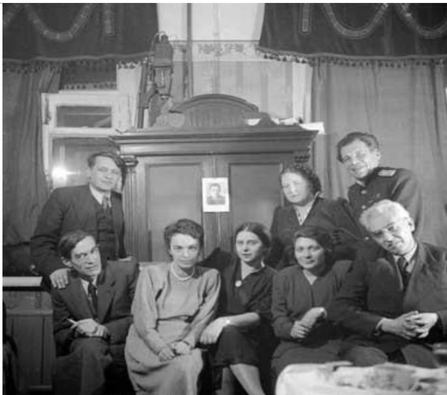
Школа Л.С. Выготского (конец 1940-х), в середине – портрет Л.С. Выготского

Еще в Харькове А.Н. Леонтьев начал теоретические и экспериментальные исследования проблемы возникновения ощущений, схематизировал основные этапы филогенеза и функциональные уровни развития психики. В данных работах Леонтьев изучал основы психической структуры человеческого сознания. Результаты исследований были представлены в докторской диссертации «Проблемы развития психики» в двух томах.