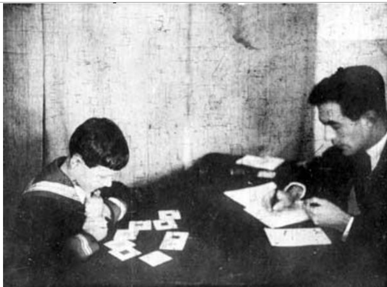
А.Н. Леонтьев за изучением памяти. Вторая половина 20-х годов.

В начале 1930-х годов в связи с последовательным усилением прямого влияния Сталина на различные области советского государства, политико-идеологические условия начали влиять на деятельность многих участников группы. Как пишут Tunes и Prestes (2009, с. 293-294), в это время: