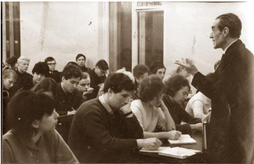
Фото: А.Н. Леонтьев читает лекцию на факультете психологии Московского государственного университета (24 мая 1969 года)