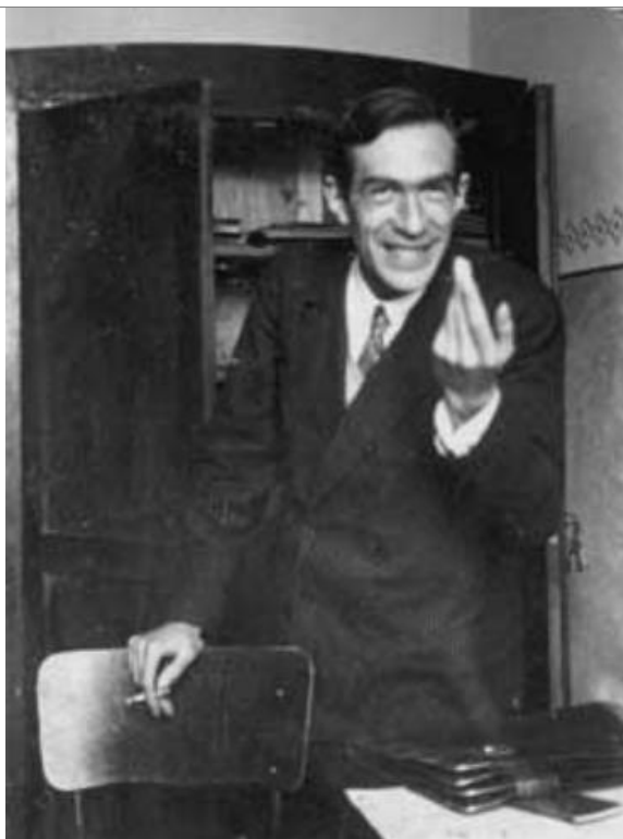
А.Н. Леонтьев в Харькове. Знаменитый, легкоузнаваемый жест.

В это время исследования А.Н. Леонтьева и его коллег имели целью создать и сформулировать основные положения для развития теории деятельности. Ученый занимался структурными элементами и компонентами деятельности, определил различия между инструментами (орудиями), используемыми человеком, и вспомогательными средствами животных, разработал структуру внутренних психических функций и внешней предметной деятельности, а также общую психическую структуру деятельности и др. Сотрудничество с харьковскими психологами продолжалось и после того, как А.Н. Леонтьев вернулся в Москву. В октябре 1934 г., уже после смерти Л.С. Выготского, А.Н. Леонтьев получил должность заведующего лабораторией возрастной (затем генетической) психологии во Всесоюзном институте экспериментальной медицины (ВИЭМе) в Москве и стал профессором Высшего коммунистического института просвещения (ВКИПа). Он также вернулся к работе в Институте психологии в Москве в 1937 году.